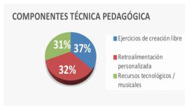
Figura 2. Componentes para una técnica didáctica que refuerce la pedagogía de enseñanza del proceso estilístico.

Se identificó componentes clave para desarrollar una técnica pedagógica que integre la música en el proceso estilístico, basados en las respuestas de los participantes sobre su efectividad percibida.